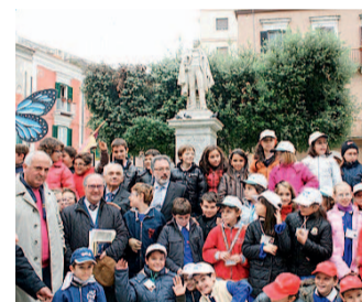
Il monumento restaurato